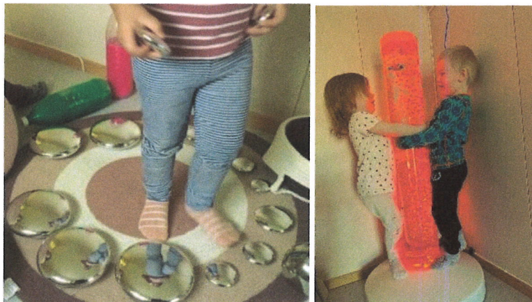
Morsomt å se seg selv i speilkulene og vannrøret skifter farge!

Visjon - Vi ser hva barna trenger – og hjelper dem enda lenger!