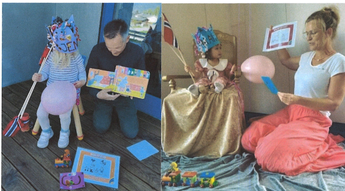
Barna er stolte over styrkekort med bursdagshilsen - og at vi ser hvilke gode egenskaper de har!