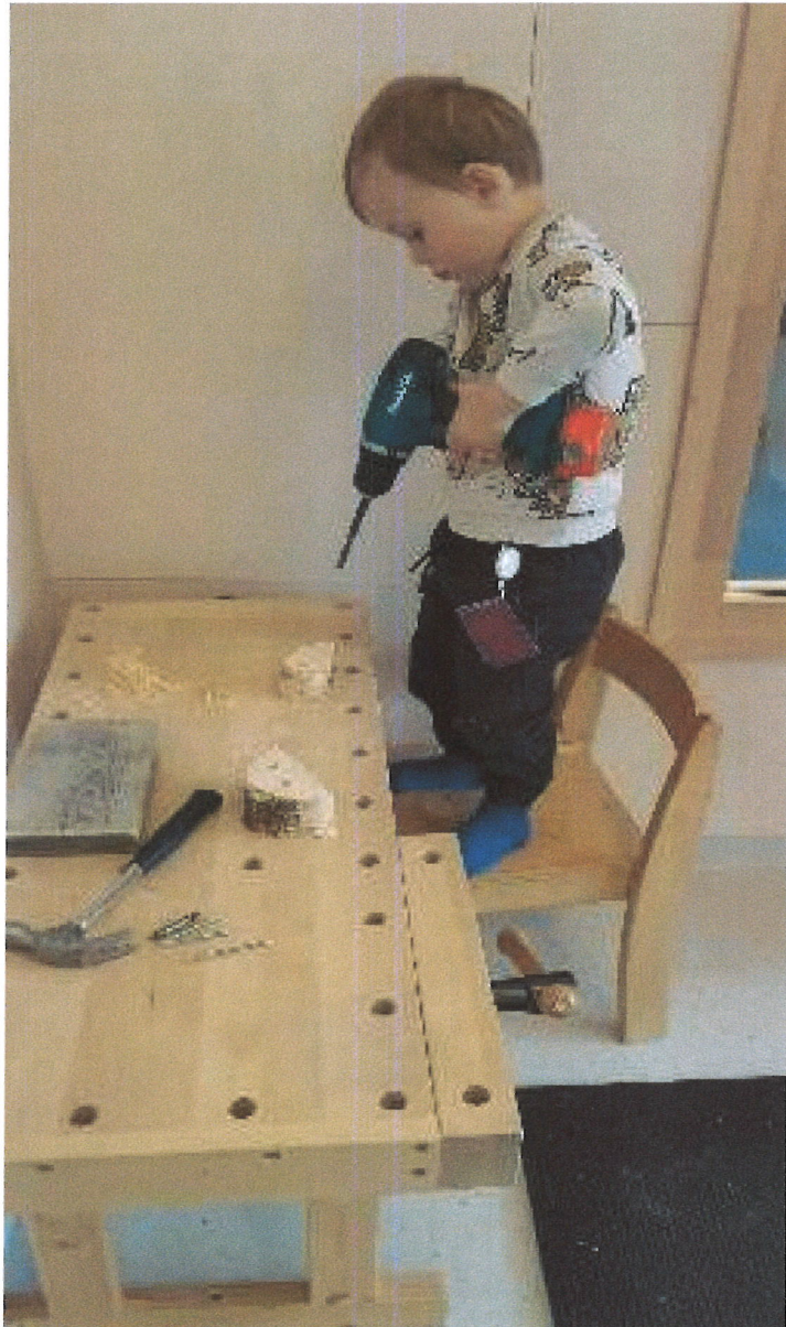
3-åring lager innsekts hotell

Forskning tilsier at fysisk aktivitet, lek og trygge gode relasjoner er det beste for barnas utvikling. I Hagehaugen barnehage legger vi stor vekt på nettopp dette. Hos oss får barna utfolde seg. Noen ganger faller de, men de reiser seg og mestrer.