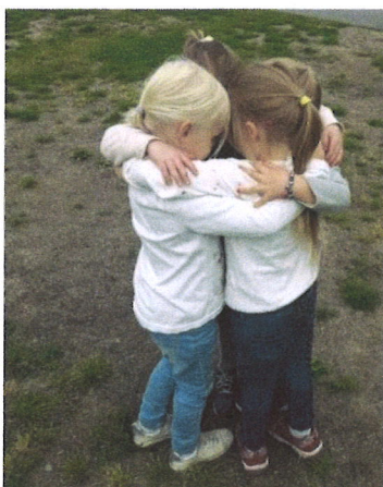
Godt å vite at en har gode venner!

I rammeplanen skisseres det fire sentrale søyler – omsorg, lek, læring og danning som skal være fundamentet for alt vi gjør med barna. Vi ser for oss et hus som står på disse søylene. Blir det for mye av det ene og mindre av noe annet, kommer huset til å velte. Vi kan ikke bare legge til rette for god omsorg og trygghet gjennom f.eks. «trygghetssirkelen». Barna skal lære ferdigheter, og de skal bli gode medmennesker i fremtiden. Grunnlaget legges i barneårene. En barnehage som har likevekt i disse «søylene» står støtt i arbeidet med barna.